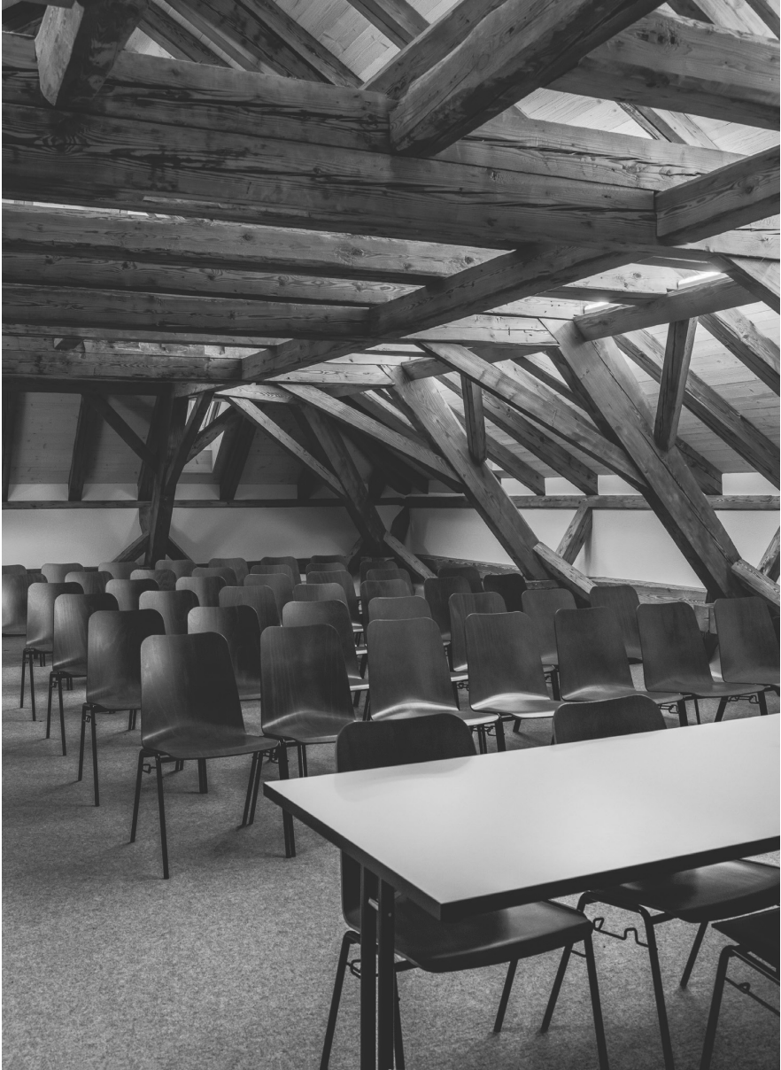
Seminarraum im Dachgeschoss des Altbaus